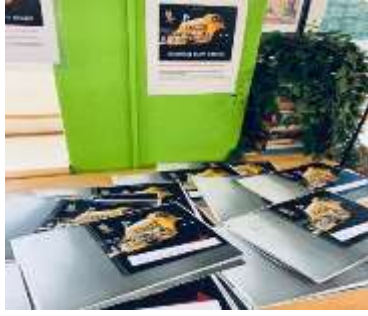
Die ausgestellten selbst geschriebenen Bilderbücher